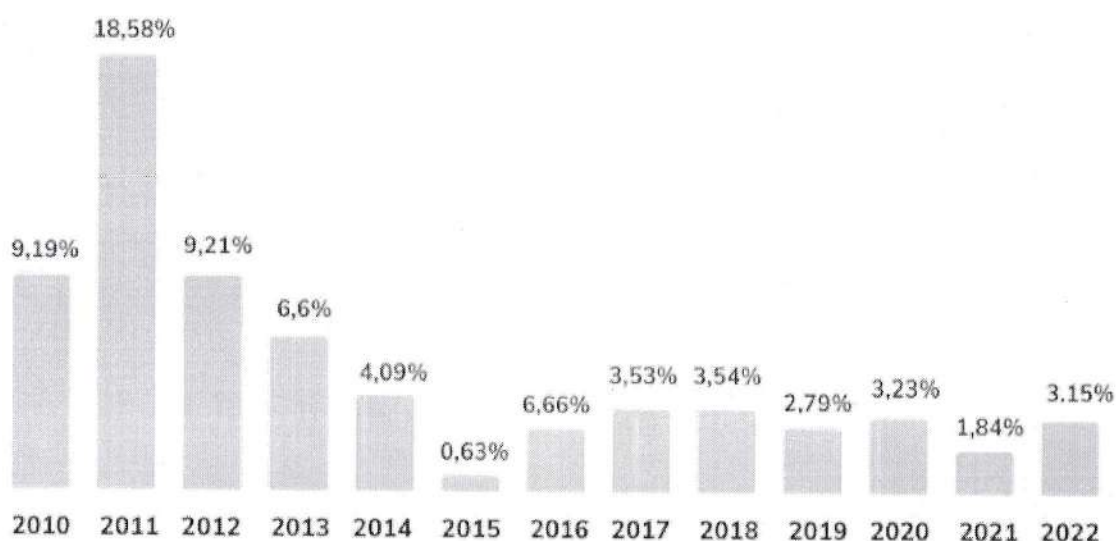
Biểu đồ 2: Lạm phát của Việt Nam qua các năm