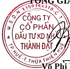
Võ Phi Hùng