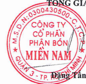
Đặng Tân Thành