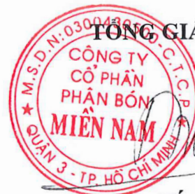
Đặng Tấn Thành