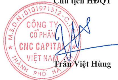
Trần Việt Hùng