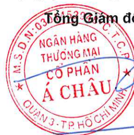
Từ Tiến Phát