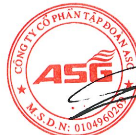
Dương Đức Tính Chủ tịch Hội đồng quản trị