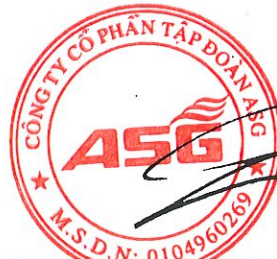
Dương Đức Tính Chủ tịch Hội đồng quản trị