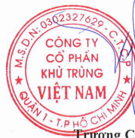
Trương Công Cừ