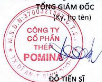
ĐỖ TIẾN SĨ