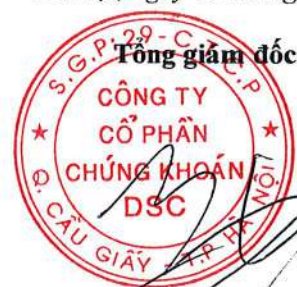
BẠCH QUỐC VINH