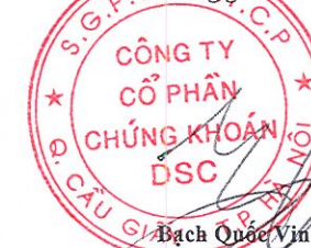
Bạch Quốc Vinh