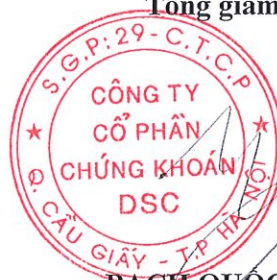
BẠCH QUỐC VINH