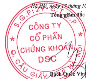
Bạch Quốc Vinh