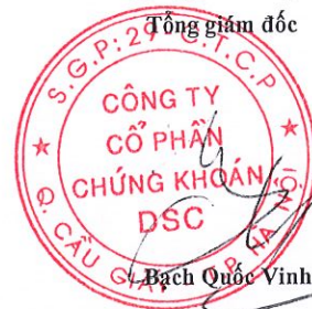
Bạch Quốc Vinh