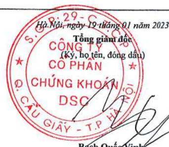
Bạch Quốc Vinh