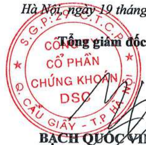
BẠCH QUỐC VINH